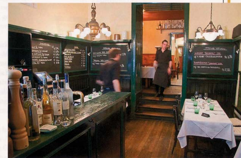
»APPIANO« Typische Beislatmosphäre, gehobene Küche und viele gute Weine, auch glasweise.

Lokale wie »Rudis Beisl« und »Schreiners« leben von ihrem Lokalkolorit. Ein echtes Wiener Beisl braucht eine entsprechende Einrichtung, aber vor allem eine ganz spezielle Atmosphäre im Grenzland zwischen weinseliger Urigkeit und unergründlichem Wohlbehagen. Nur so wird es dem Begriff Beisl gerecht. Woher dieser Name stammt, darüber streiten sich übrigens die Gelehrten. Die einen glauben, er sei