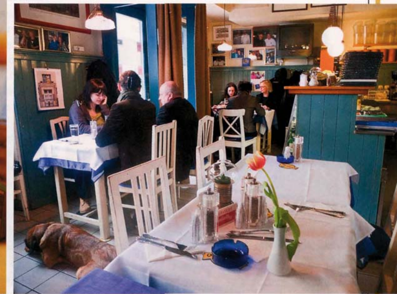
»RUDIS BEISL« »Da sitzen Grantler, Dichterinnen, Zimmerwirtinnen und Rentner dicht gedrängt ...«