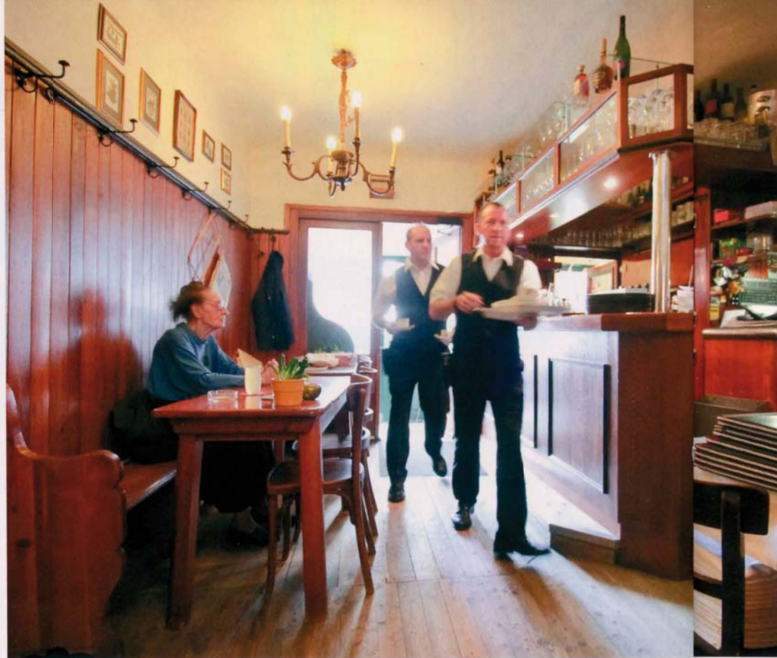
»ZU DEN 3 HACKEN« Grenzland zwischen weinseliger Urigkeit und wienerischem Wohlbehagen